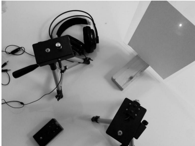
Abbildung 1: Funktionsweise eines Lasermikrofons. Der Laser (unten rechts) wird auf eine reflektierende Oberfläche (oben rechts) gerichtet, während mit einem Empfänger (oben links) der reflektierte Laserstrahl aufgefangen und hörbar gemacht wird.

Auch nach der Ergänzung des § 90 TKG um die «sonstigen Telekommunikationsanlagen» im Rahmen der TKG-Novelle im Jahr 2012 werden kabelgebundene Geräte nicht erfasst. Entgegen der Definition aus § 3 Nr. 23 TKG umfasst der Begriff der Telekommunikationsanlage nur drahtlose Anlagen. 18 Kabelgebundene optische Übertragungen bspw. über Glasfaserkabel werden von der Vorschrift nicht erfasst. Vielmehr wollte der Gesetzgeber die Norm möglichst technikoffen gestalten und sicherstellen, dass auch neuere technische Funktionsprinzipien, wie z.B. Lasermikrofone, durch § 90 TKG erfasst sind. 19