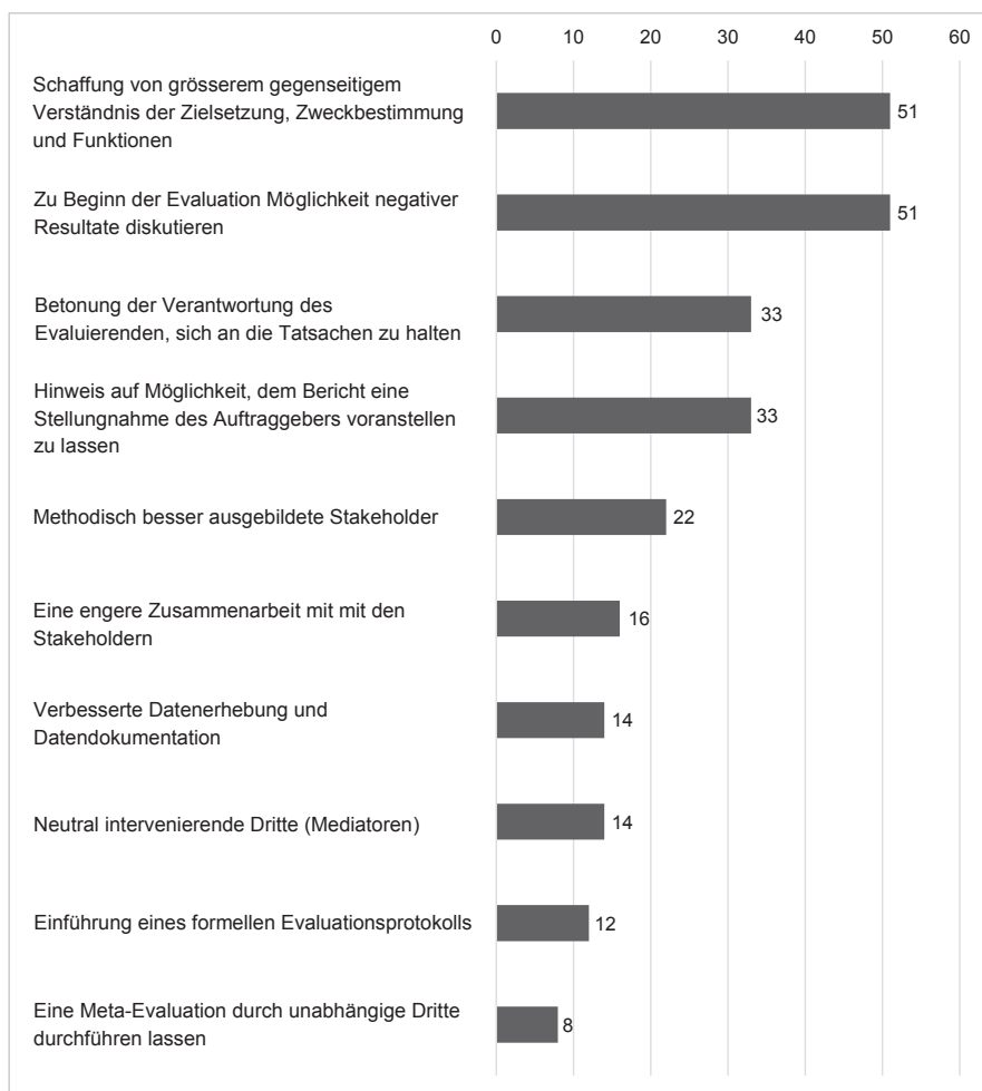
Abbildung 5: Zustimmung zu präventiven Massnahmen zur Verhinderung von Beeinflussung (N = 51)

Anmerkung: Angaben in Prozent, Mehrfachnennungen möglich (in Anlehnung an Pleger/Sager 2016)